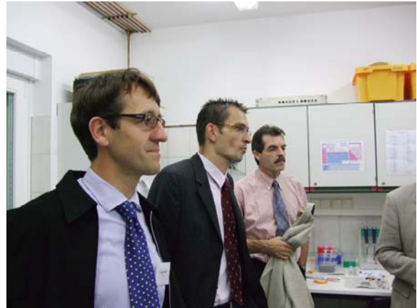
Erfahrungsaustausch im Labor