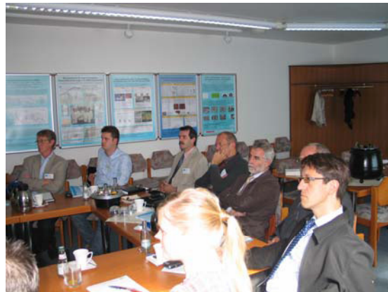
Vortragspräsentationen im Konferenzraum des iba